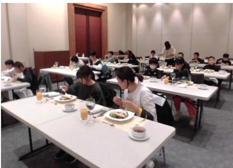
【ホテルでのテーブルマナー】