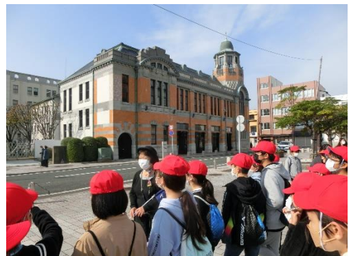
【門司港レトロ見学】