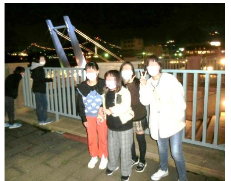
【ホテルからの夜景観賞】