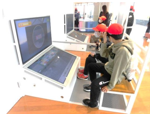
【門司港レトロ見学】