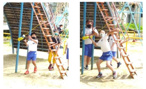
ボール投げの練習

全学年で、50m走、ソフトボール投げ、反復横跳び、握力、長座体前屈、立ち幅跳びの6種目のテストを実施しています。運動場では、右の写真のように休み時間にボール投げ練習に取り組んでいます。なお、新型コロナウイルス感染拡大防止のため、今年度は、上体起こし、20mシャトルランは、実施しないことになりました。