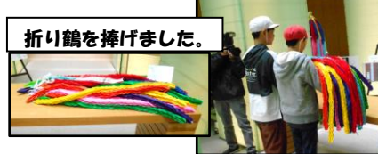
折り鶴を捧げました。