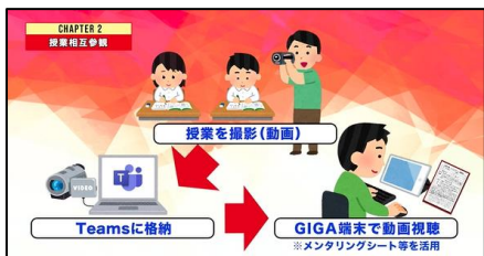
人材育成のためのOJTの スメ～授業づくり編2～