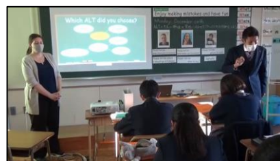
令和3年度公開授業 (浅川中学校3年) 研究発表、指導講話 (文部科学省調査官)