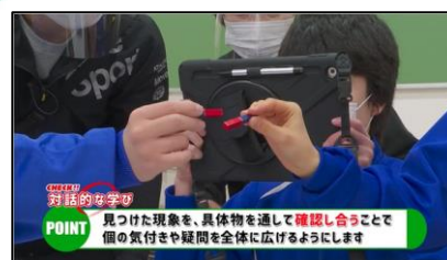
POINT 見つけた現象を、具体物を通して確認し合うことで個の気づきや疑問を全体に広げることができます 特別支援学校中学部1年生理科 じしゃくのふしぎ