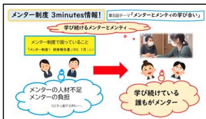
メンター制度 3 minutes 情報! (全6回まとめ)