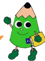
北九州市立教育センター マスコットキャラクター 「せんたん」

「kitaQ せんせいチャンネル」には、自己研鑽に役立つコンテンツがたくさんあります。新たに掲載されたものを一部紹介します。夏季休業期間中に、ぜひアクセスしてください。