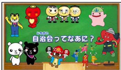
わくわく! 北九州 (令和4年度版) → 冊子、画像データ グラ・マップ北九州 2022 → グラフデータ 自治会・町内会のはたらき → 動画16本