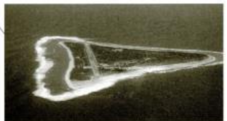
日本の東のはし、南鳥島(東京都)