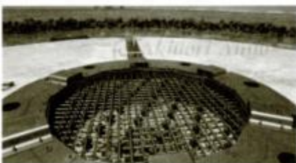
日本の南のはし、沖ノ島(東京都)