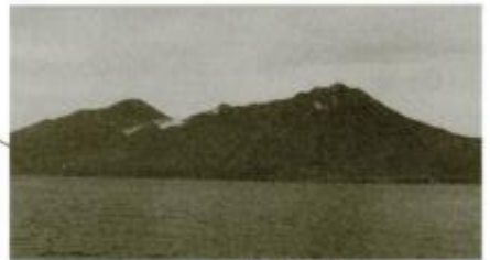
日本の北のはし、択捉島(北海道)