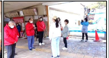
2/20 餅つきの売上金を義援金として贈呈し、お礼の言葉を頂きました