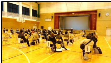
2/3 保護者を対象にした、入学説明会で熱心に話を聞く保護者の皆様。

今回、地域の人たちと協力して、餅を売って、たくさんの人に買ってもらうことができてよかった。そして、売ったお金を復興に役立てることができてよかった。