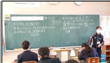
2/9 枝光商店街復興支援餅つきの事前指導で真剣に学習する1年生。