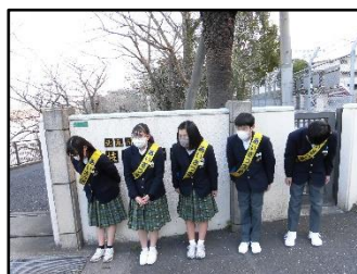
1/19 3学期のあいさつ運動を行いました。