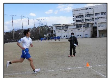
1/19 保健体育で持久走の研究授業を行いました。