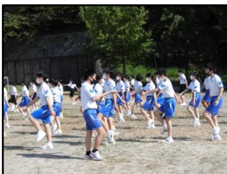
9/21 体育大会に向けた枝光台中伝統の入場行進の練習です。