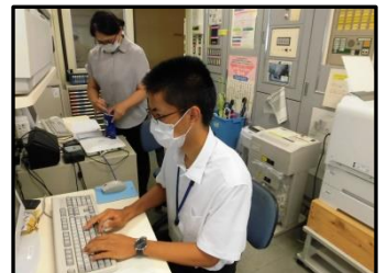
9/27 大学生のボランティアの方にもお手伝いをしてもらっています。