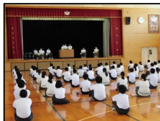
9/22 生徒会役員選挙のための立会演説会が開かれました。