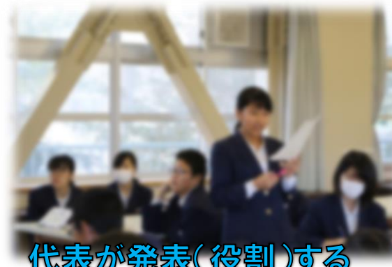
代表が発表(役割)する