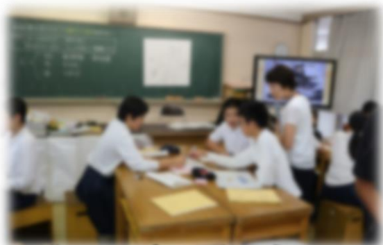
グループで話し合う