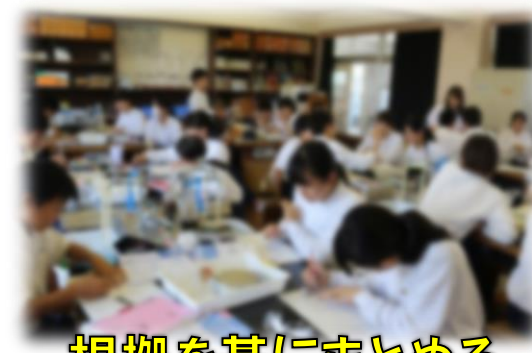
根拠を基にまとめる