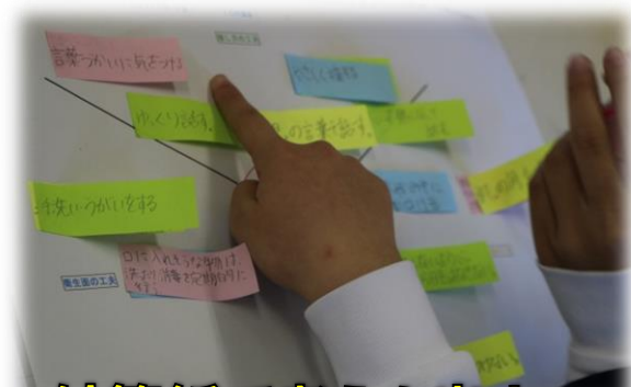
付箋紙で考えを出す