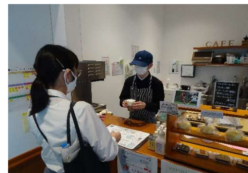
サンキュウ・ウイズ