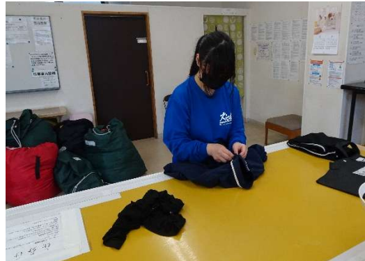
わーくわーく戸畑

7月1日の実習報告会では、皆さんの実習での学びと今後への決意などが報告されることを楽しみにしています。