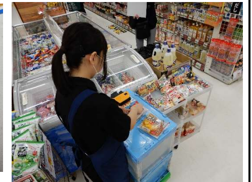
サンキュードラッグ一枝店