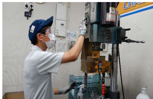
戸畑ターレット工作所