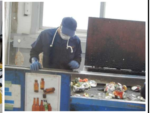
日明りサイクル工房