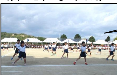
ドキメキダイアリー(1年)