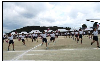
千代っ子ダンスホール☆(3年)