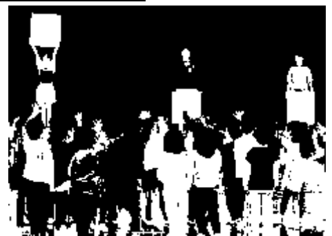
かちぬきじゃんけん