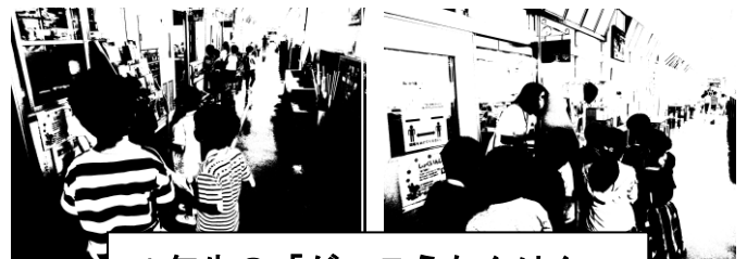
1年生の「がっこうたんけん」

1年生は生活科で、「がっこうたんけん」をしました。先輩の2年生が1年生を引率して、学校のいろいろな所を案内し、丁寧に分かり易く説明してくれました。とても微笑ましい姿でした。