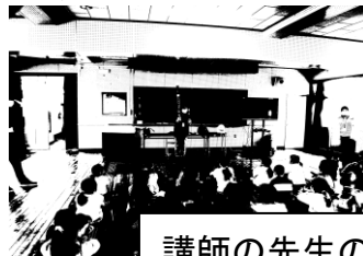
講師の先生のリコーダー講習会

3年生に進級すると、社会科、理科、総合的な学習の時間などの学習が増え、音楽ではリコーダー、国語科では毛筆学習（習字）が始まります。3年生は、たいへんですが頑張っています。リコーダー講習会と毛筆学習では、わくわくどくどきしながら楽しそうに取り組んでいました。毛筆学習では、師範の先生が今後も継続的に指導をしてくださいます。