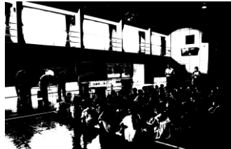
環境局出張授業（リサイクルの説明・パッカー車積み込み体験）