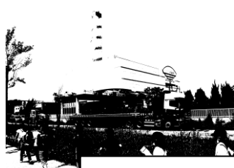
環境局皇后崎工場（清掃工場）

4年生は、5月16日に「環境局皇后崎工場見学」、31日に「天文学習・いのちのたび博物館見学」を行いました。どの施設でも、4年生の見学マナーや学習する態度のよさを褒めていただきました。また、6月5日の「環境局出張授業」でも、リサイクルの説明をしっかりと聞いたり、パッカー車のごみの積み込み体験なども真剣に行ったりして、環境局の方が、4年生の態度のよさにびっくりしていました。さすが、穴生小学校の4年生です。とっても嬉しいことです。