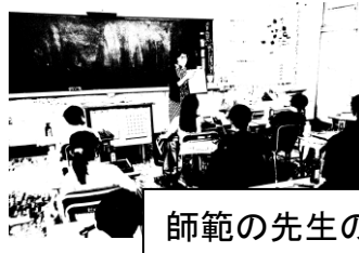
師範の先生の毛筆学習の指導