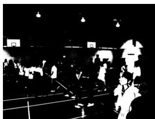
盛り上がったレクリエーション