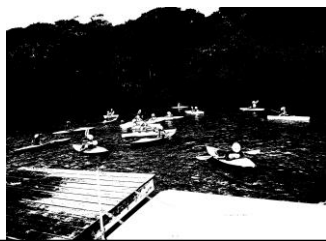
すいすい進んだカヌー