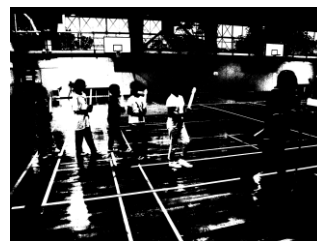
キャンドルの集いのリハーサル