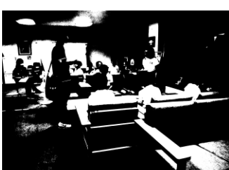
振り返りを行う班長会議