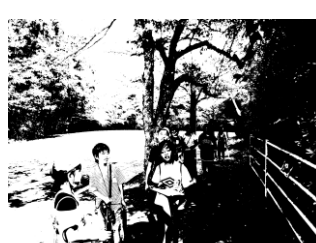
みんなで協力OLビンゴラリーGP