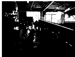
ポルタリングに挑戦