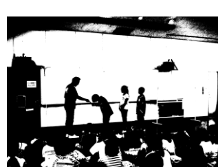
思い出を胸に退所式