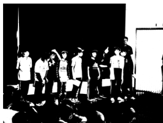
わくわくどきどき入所式

8月30日～31日に、5年生は、玄海青年の家で自然教室を行いました。暑い中でしたが、熱中症対策を講じながら実施しました。普段とは違う豊かな自然環境の中で、集団宿泊生活を通して、たくさんのことを心と体で学びました。5年生が、またひとつ大きく成長しました。