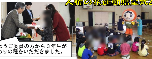
人権ようご委員の方から3年生がひまわりの種をいただきました。