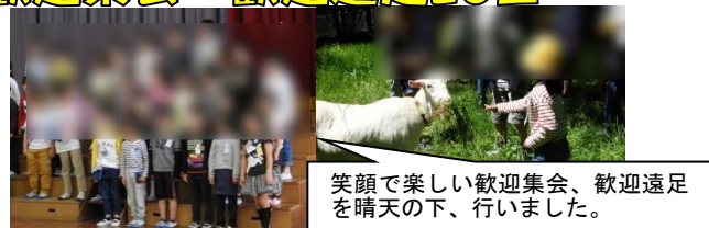
笑顔で楽しい歓迎集会、歓迎遠足を晴天の下、行いました。