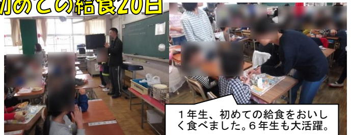
1年生、初めての給食をおいしく食べました。6年生も大活躍。

授業参観及びPTA総会には、たくさんの保護者の皆様にご出席いただきありがとうございました。今年度も実りあるPTA活動となりますようどうぞよろしくをお願いします。（29年度新役員・敬称略）