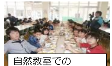
自然教室での 楽しい食事時間

5年生では、11月7日、8日に玄海青年の家で「自然教室」を行いました。1泊2日の生活の中で、子どもたちは、協力したり支え合ったりする大切さを体験を通して学び、友達の素晴らしさを改めて感じることができました。5年生一人一人が成長しています。もうすぐ6年生になるという自覚も芽生えてきました。