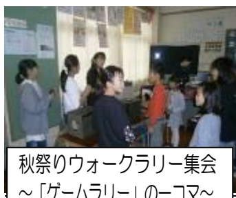
秋祭りウォークラリー集会 ～「ゲームラリー」のコマ～

全校で、異学年による縦割りグループで活動する「秋祭りウォークラリー集会」を行い、上級生と下級生が仲よく活動しました。微笑ましい姿が多く見られました。