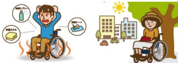
イラスト：厚生労働省リーフレット

なお、宿泊学習や校外学習(遠足や社会科見学など)については、その場所の暑さ指数等の状況を見て判断します。また、観測地点(八幡)の暑さ指数の予測値が33未満の場合も、これまで通り、「学校における熱中症対策ガイドライン」の方針に従い、それぞれの活動場所において、随時暑さ指数を測定し、活動の実施時間や内容について判断します。