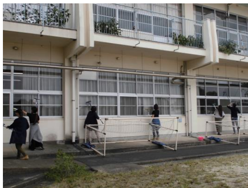
<PTAクリーン作戦の様子>