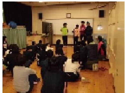
<中学部作業実習報告会の様子>

中学部は11月5日～16日まで作業実習が行われました。19日（月）には報告会がありました。2週間、続けて集中して取り組んでいる姿に感心しました。報告会では少し緊張していましたが、一人ずつ感想や頑張ったことを発表することができ、高等部につながる報告会となりました。