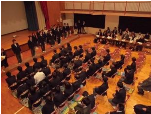
<高等部実習報告会の様子>

11月に入り、寒くなってきました。インフルエンザやノロウイルス等感染で起きる病気が増加する季節となりました。手洗い、うがいや咳エチケット等に注意しましょう。また、体調の悪い時は早めに受診して無理をしないようにしましょう。