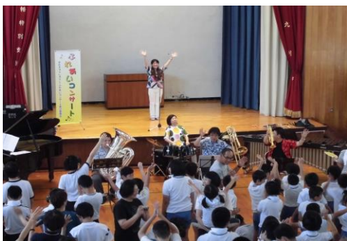
<コンサートの様子>