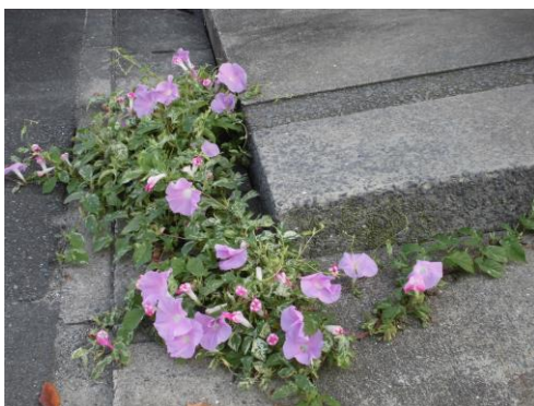
< アサガオの生命に感動 >

10月14日（日）は、いよいよ学習発表会です。みんなで力を合わせて、成功させることを誓いました。一人一人の児童生徒にとりまして、励みとなりますよう、あたたかいご支援ご協力のほどよろしくお願いいたします。