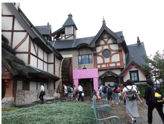
<ハーモニーランドにて>