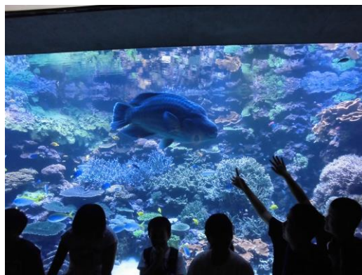
< うみたまごにて >