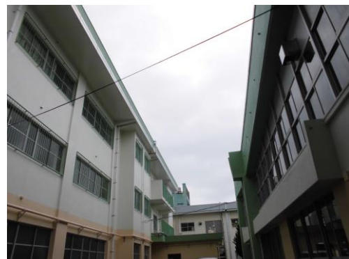
< 外壁工事が終了した校舎 >