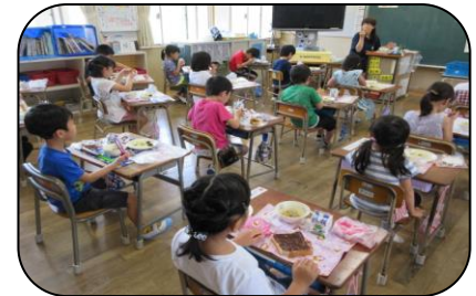
座席を離し、前を向いたまま静かに食事をします(さびしいですが・・・)