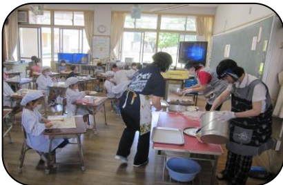
1年生の教室では、複数の教職員がフェイスシールドをして配膳しています

先週から始まった給食は、新型コロナウイルス感染防止という点から、学校生活の中でも最も気を使う活動の一つです。