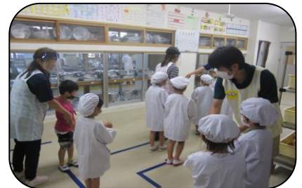
給食室の中でも「密」にならないように間隔をとって一方通行で動きます

友だちと顔を見合わせ、楽しくおしゃべりしながら給食を食べることができるようまで、全力でがんばります。