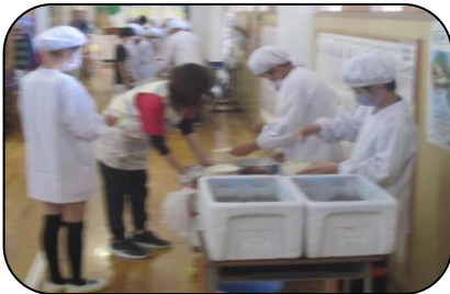
子どもの人数によっては、廊下を使って配膳する学級もあります