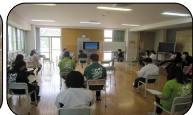
← 間隔をあけての研修会