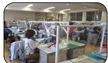
← ビニルシートを張った職員室