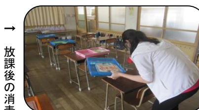
→ 放課後の消毒やトイレ清掃 →

当然のことながら、教職員もウイルスを入れたり広げたりしないための新たな取組や業務を行っています。現在、原則学校においていただけないので一部を紹介します。