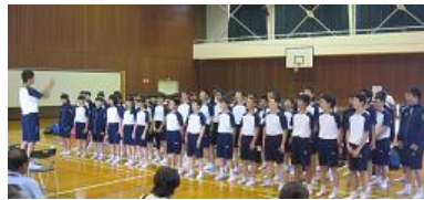
退村式では合唱で感謝の気持ちを伝えました