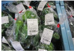
子どもたちの収穫物が道の駅に