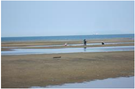
海の自然を満喫したグループも

1日目は少し雨に降られましたが、2日目・3日目と好天に恵まれ、2年生が国東市「農村民泊体験学習」を無事終えて帰ってきました。たくましく成長した2年生の今後に期待しましょう。