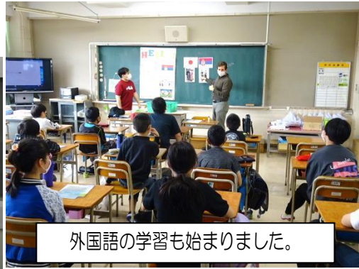
外国語の学習も始まりました。