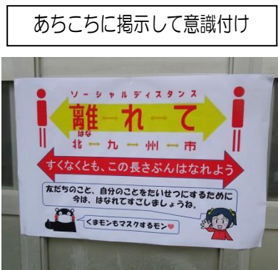
あちこちに掲示して意識付け