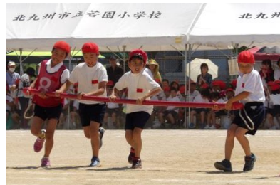
▲3年生の「若園ハリケーン」の様子