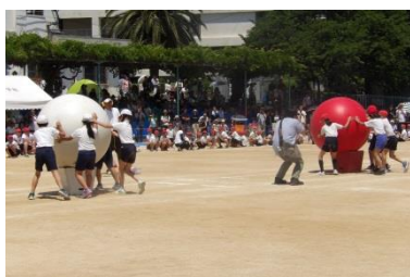
▲全校「若園の「わ」」の様子