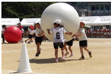
▲2年生の「ありさんのひっこし」の様子