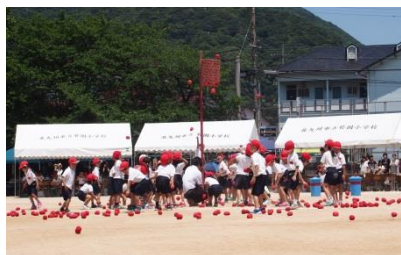
▲1年生の「玉のふんすい」の様子

5月28日の体育大会は、さわやかな天候に恵まれ予定通り開催できました。朝から青空がのぞき、PM2.5等の影響もなく無事終了しました。本年度も「自分のめあてに向かってがんばる」ことを目指した体育大会でしたが、各学年とも練習段階から真剣に取り組む子どもたちの表情や姿をたくさん見ることができました。また、5・6年生は、自分の受け持った係の仕事に責任をもち、最後までやり遂げることで大きな自信につなげることができました。努力することの大切さを実感し、充実した体育大会になりました。当日はお忙しい中、ご来校いただきました来賓の皆様、そして運営を支えてくださったPTA役員や各委員、おやじの会の皆様、ご理解いただいた近隣の皆様、応援していただいた保護者の皆様に、心より感謝申し上げます。ありがとうございました。