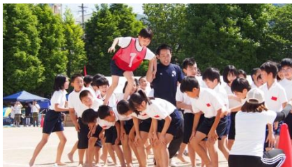
▲5年生「背わりたービー」の様子