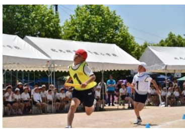
▲全校「紅白リレー」の様子

十六日金 学習参観・懇話会です 十六日は、本年度二回目の学習参観です。学習に臨む子どもたちの様子をご覧いただくとともに、担任から学級経営方針等についてお話しさせていただきます。ご来校いただきますようお願いいたします。