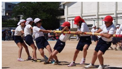
▲4年生「これ運命の竹です!」の様子