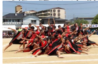
▲5・6年生「若小ソーラン」の様子