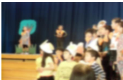
1年生 きつねのおきやくさま

先週の土曜日に行った学習発表会には、多数の保護者の皆様、そして地域の皆様にご参加いただきました。