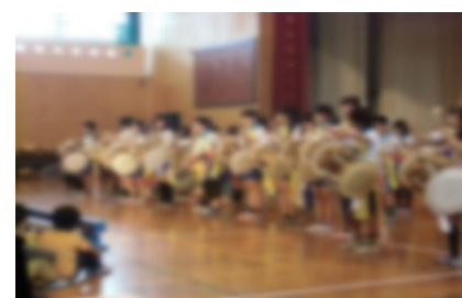
アンニョンクラブ プンムル(農楽)

演奏、歌声、演技、説明など、様々な表現形態を通して、子どもたちが、学習の成果を十分発表できました。