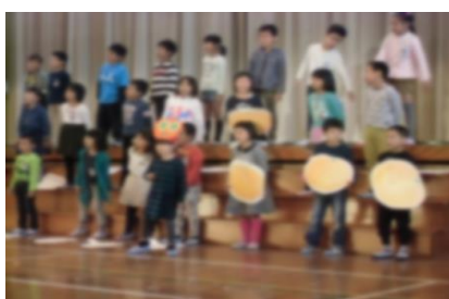
2年生 はらぺこあおむし ドレミのうた