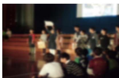
3年生 輝け！若松商店街