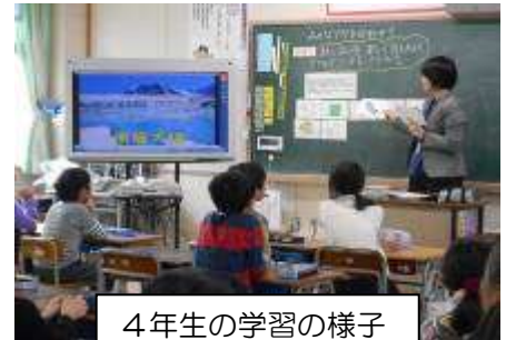
4年生の学習の様子

お子様にインターネットを利用させる際の保護者の責務が規定されています。(青少年インターネット環境整備法第6条)