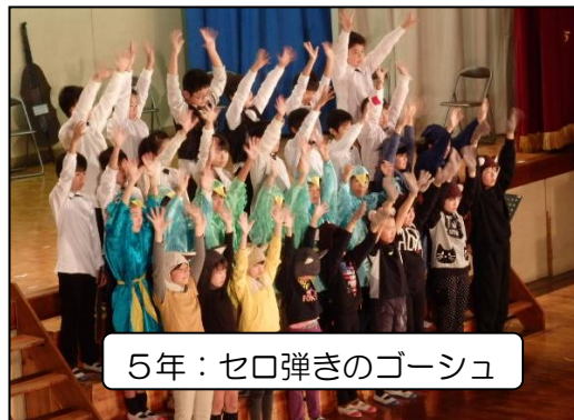
5年：ゼロ弾きのゴーシュ