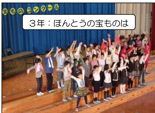
3年：ほんとうの宝ものは

各学年のテーマが明確で、皆がとてもよくまとまっていたと思います。連携もよくて、全てスムーズで気持ち良く見ることができました。ありがとうございました。