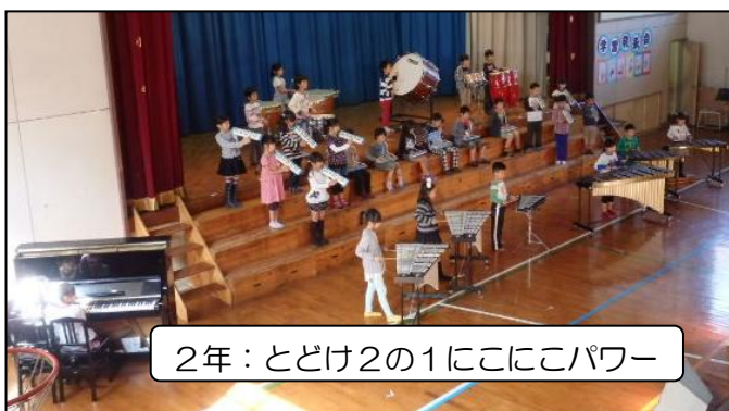
2年：とどけ2の1にここにパワー