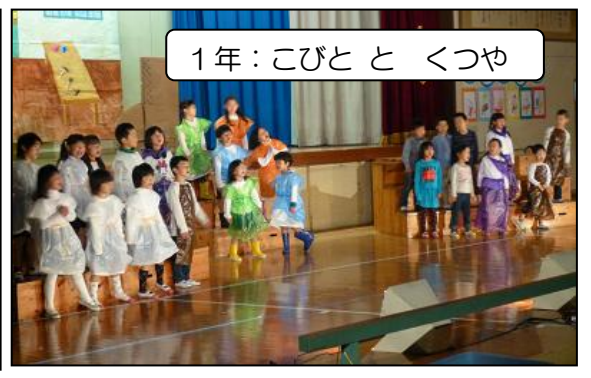
1年：こびととくつや