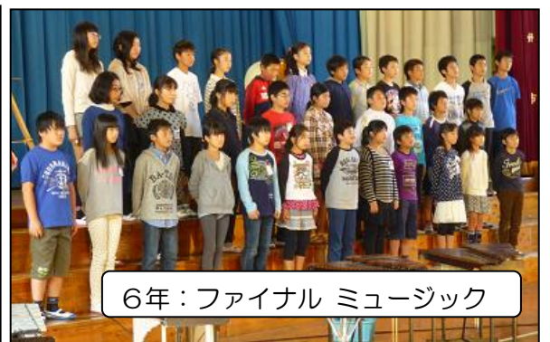
6年：ファイナル ミュージック