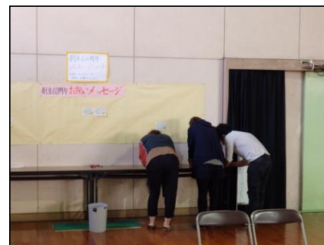
＜メッセージ書きへのご協力ありがとうございました＞

なお、PTA関係者の方々のご尽力により、創立60周年記念誌を各ご家庭にお配りいたしました。重ねてお礼申し上げます。