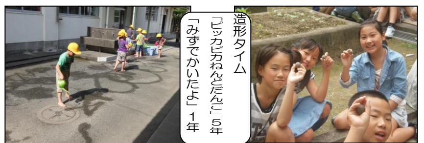
造形タイム 「まっか」万ねんたん「5年」 「みずでかいたよ」1年