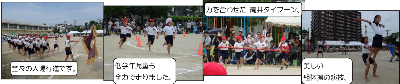
堂々の入場行進です。

保護者、地域の皆様には、早朝よりご観覧くださり、誠にありがとうございました。筒井まちづくり協議会地域安全部会の皆様には校地内の警備をしていただき、また、演技終了後の片付けには、大変多くの保護者や卒業生にお力添えをいただきました。心よりお礼申し上げます。ありがとうございました。