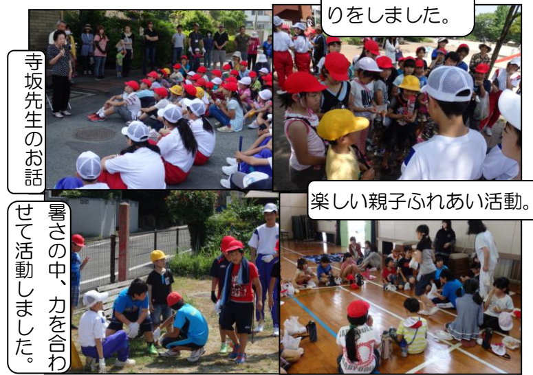
みんなで振り返りをしました。

本年度2回目の土曜日授業として、5月31日(土)、子ども達は、熊西中学校生徒・保護者の皆様といっしょに「小中連携まち美化大作戦」に取り組みました。日差しの照りつける中での活動でしたが、子ども達は、雑草を抜いたり、落ち葉やごみを拾い集めたりして、とてもよく働きました。中学生のお兄さん・お姉さんともなかよく活動し、よい交流の機会となりました。また、その後の「親子ふれあい活動」では、PTA役員の皆様にお世話をいただき、パンとジュースで楽しいひと時を過ごすことができました。ご参加いただいた保護者の皆様、進行にご協力いただいたPTA役員の皆様、本当にありがとうございました。