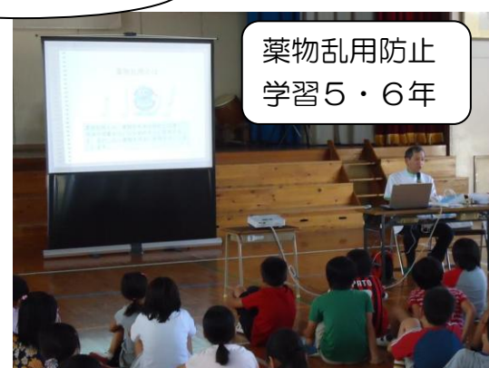
薬物乱用防止 学習5・6年