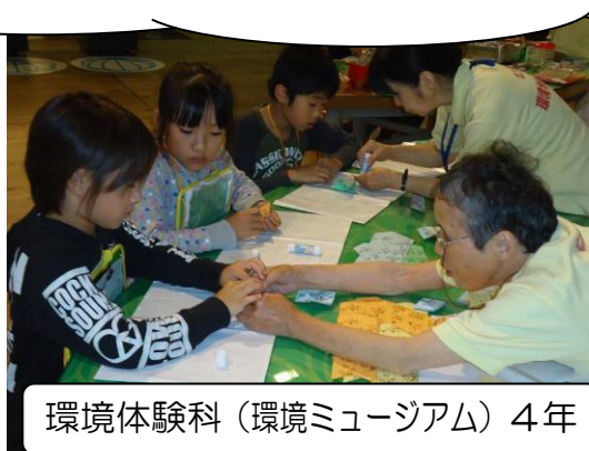
環境体験科(環境ミュージアム)4年