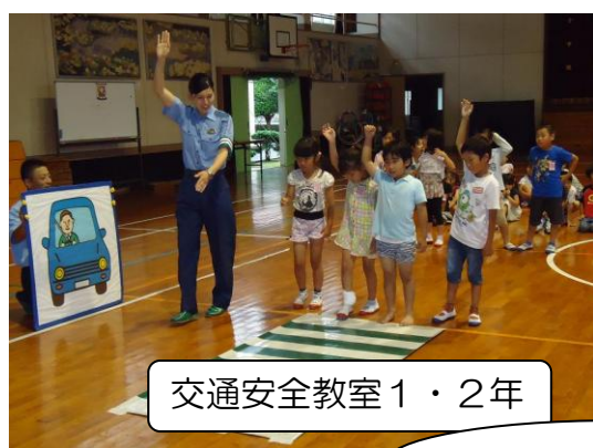
交通安全教室1・2年

明日からは、いよいよ子どもたちが待ちに待った夏休みです。この43日間は、お子様にとって、健康で事故や怪我のない夏休み、楽しく思い出に残る夏休みとなることを願っています。そして、9月2日(月)には、また、全員が元気な笑顔で会えることを楽しみにしています。