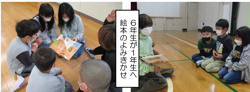
6年生が1年生へ 絵本のよみきかせ