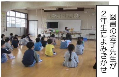
図書の子先生が2年生によみきかせ

4月22日は、「子ども読書の日」の取組を全校で行いました。1時間目は各クラスで一斉読書をし、もう1時間は絵本の読み聞かせを行いました。6年生が下級生に優しく、丁寧に読み聞かせをしている姿は、とてもほほえましく、頼もしさを感じました。