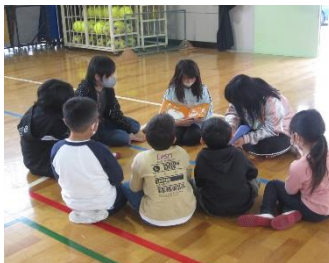
6年生が1年生へ絵本のよみきかせ