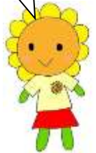
マスコットキャラクター とばシャキひまわり