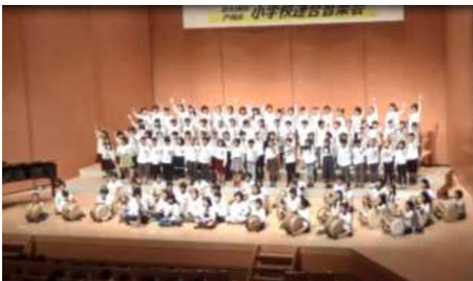
器楽合奏「サムルノリ」

また、この日は区内8校の4年生全員が集いました。どの学校も、これまでの練習の成果を発揮して、美しい歌声や演奏を発表し、素晴らしい音楽会となりました。他校のお友達の合唱や器楽合奏にも、真剣に聴き入っていました。互いの発表に感動し合い、惜しみなく拍手を贈る姿に、学校の代表として頼もしく感じました。