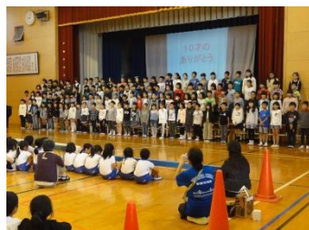
下段左 4年 歌唱「10才のありがとう」 下段中 5年 劇「三太郎ものがたり」 下段右 6年 合唱・器楽 「夢に向かって」