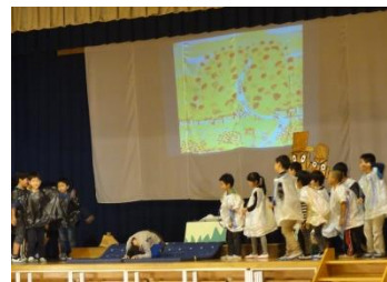
上段左 1年 音楽劇「くらぐも」 上段中 2年 劇「スイミー」 上段右 3年 劇「三年とうげ」