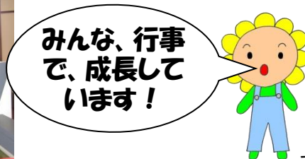
マスコットキャラクターとばしゃきひまわり