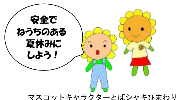
マスコットキャラクターとばシャキひまわり