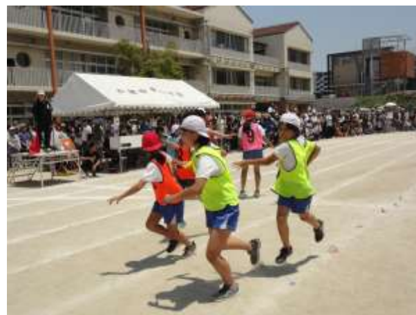
「紅白リレー（女子）」の様子