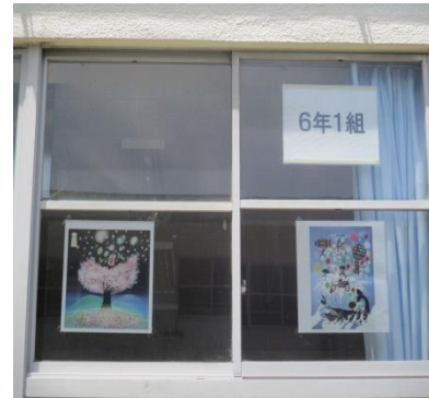
きれいな絵を貼りました。