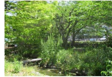
みどりがきれいです。