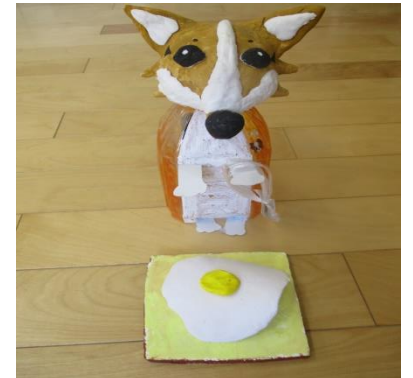
紙粘土で、誰かが上手に目玉焼きを作っていました！（食べようとしています！たいへん(ノ口)）