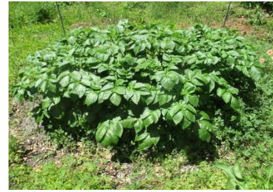
理科で使うジャガイモです。