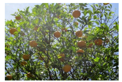
夏ミカンもよく育っています。