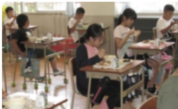
☞ [5～6年生…ただ、黙々と…食べ続けています。]