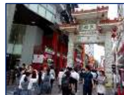
中華食べ歩き!南京町