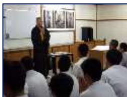
爆笑!本当にお坊さん?