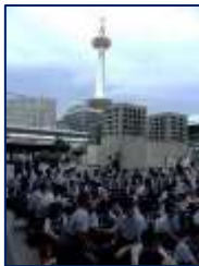
京都のランドマーク

3年生が6月6日(木)から2泊3日、京都、奈良、神戸を巡る修学旅行に出かけました。当初は3日間雨の予報でしたが、初日の京都は晴れの天気で、班別研修もスムーズに実施できました。しかし二日目は朝からあいにくの雨、しかも歩く時や写真を撮る時に限って雨足が強まり大変でした。3日目は天気が回復し、神戸南京町での食べ歩きも満喫することができました。3年生全員が参加し、途中体調を崩す人もなく、無事に終えることができて何よりでした。