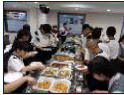
ホテルで食べ放題?バイキング