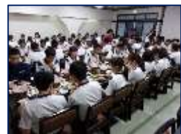
旅館の夕食はすき焼き!