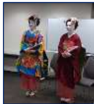
サプライズ!の舞妓さん?