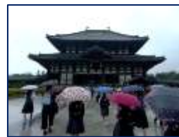
大仏殿は雨水も半端ない!