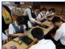
神戸・北野で革細工体験