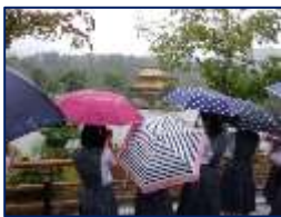
傘の花咲く金閣寺