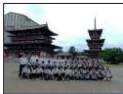
やっと撮れた集合写真