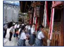
学問の神様をお願い!