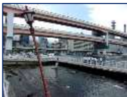
震災の教訓を忘れずに・・・