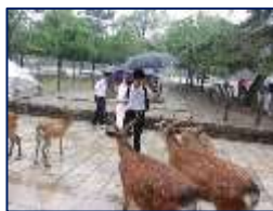
雨でも鹿は元気一杯!