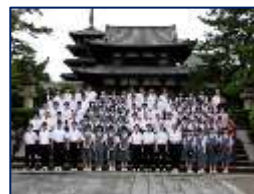
世界遺産で学年全体写真