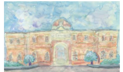
さんの作品です。(旧本事務所)

○美術部の皆さんが、「令和5年度 世界遺産のある街 北九州市・中間市 スケッチコンテスト」に応募して優秀な成績を収めました。