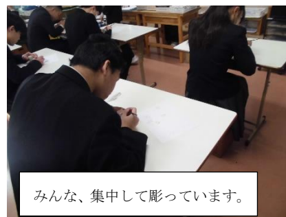
みんな、集中して彫っています。

真ん中は、美術の篆刻の様子です。アルファベットやイラストを入れて作っている人もいました。そろそろ完成した人もいます。きっと中学時代の良い思い出になるでしょう!