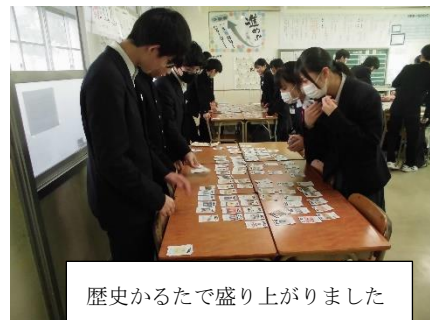
歴史かるたで盛り上がりました

一番上の写真は、社会科の「歴史かるた」の様子です。元気な声で楽しみながら、最後の年号を確認していました。