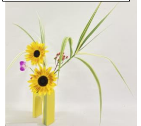
生徒の作品より(笑顔)

○華道部の皆さんがインターネット華展に応募して9名の皆さんがノミネートされました。これは日本で一番多い数です。