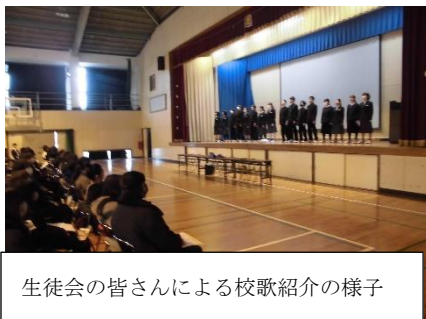
生徒会の皆さんによる校歌紹介の様子

2月2日(金)に、次年度田原中学校に入学してくる6年生のために、新入生説明会を行いました。ある3年生が「私たちの時は、こんななかった。」と言うのを聞いて、「久しぶりに(たぶん4年ぶり?)対面で実施できたんだな」と感じました。