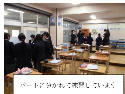
パートに分かれて練習しています

一番下は、合唱の練習です。文化発表会で聞かせてもらった素晴らしい合唱を思い出す人も多いのではないのでしょうか?他学年の生徒の皆さん