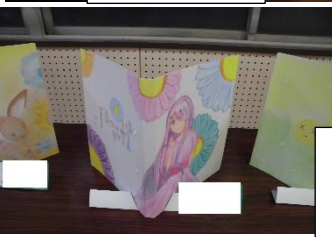
美術部の作品です。