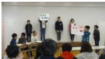
6年 6年間で振り返って