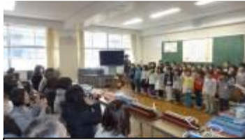
1年 できるようになったよ

2月16日（土）に土曜日授業で、学習発表会を実施しました。あいにく4年生は、インフルエンザ流行のため、学級閉鎖となり、22日（金）の実施となりました。今年度の学習の成果を保護者の皆様に見ていただく学習発表会です。どの学級でも、見に来ていただいた保護者を前に緊張の中にも一生懸命に成長した自分を見てもらおうと張り切っている児童の姿が見られました。