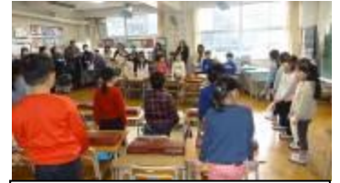
2年 あしたへジャンプ！