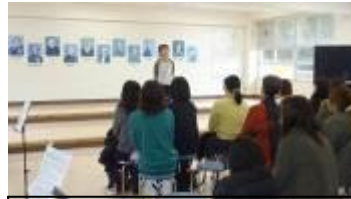
5年 1年間で振り返って