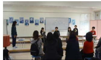
4年 1年間で振り返って