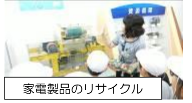
家電製品のリサイクル