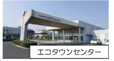
エコタウンセンター