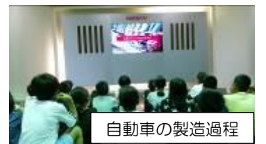
自動車の製造過程