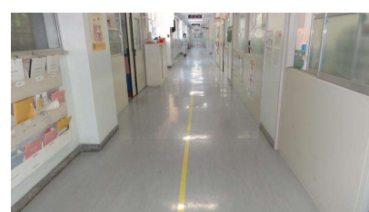
廊下での密回避の通行指定