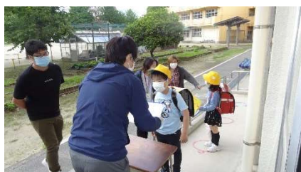
職員による朝の検温