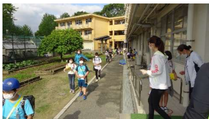
登校時ソーシャルディスタンス