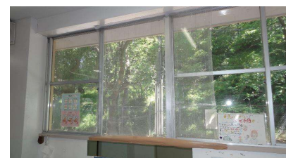
換気する上での虫対策