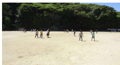
休み時間でのマスク着用