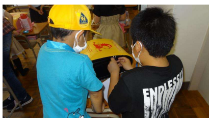
検温表をカバン横に装着