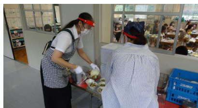
7年生による廊下での配膳