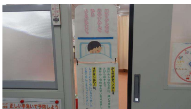
保健室使用時の表示