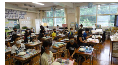
給食時の飛沫感染予防