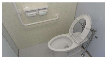
職員による便座除菌作業