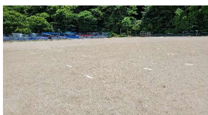
運動場でのSDの確保