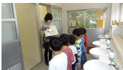
トイレ使用の際のSD確保