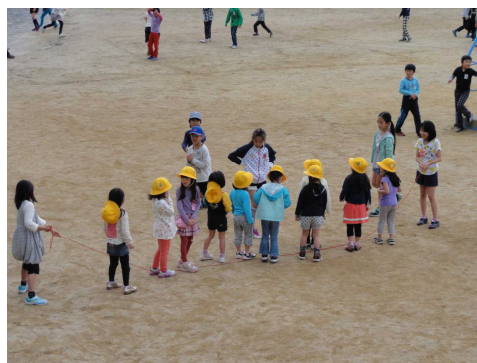
(昼休み、いっしょに楽しく縄跳び)