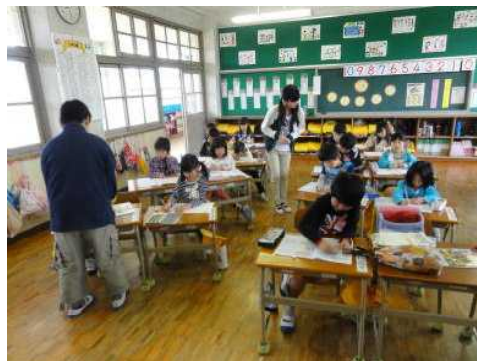
(職員朝礼の間、6年生が朝自習のお手伝い)

これらの活動を通し、1年生にとっては、やさしく教えてもらったり遊んでもらったりする中で感謝する心が、6年生には高学年としての自覚、そして、人を思いやる優しい心が育ってくれることを願っています。