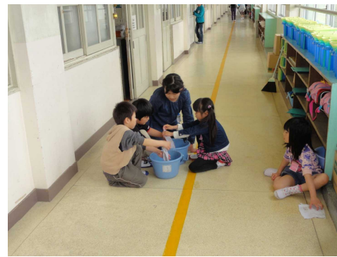
(いっしょに掃除「雑巾はこうやって絞るんよ」)