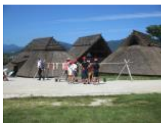
吉野ヶ里歴史公園

6年生にとって、楽しみにしていた修学旅行は終わりましたが、これからも陸上記録会、音楽会と大きな行事が控えています。その先は、卒業式、中学校進学へとつながっていきます。どのように小学校生活をまとめるのか、どのように中学校生活につなげていくのか、一人一人が将来を見据えて、日々の生活を大切に過ごしていきましょう。これからも最上級生として、折東レンジャーとして、下級生に手本となる行動や態度、姿を見せてくれることを期待しています。