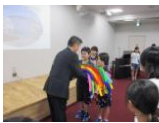
大刀洗平和記念館